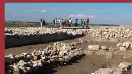
IX Campaña de excavaciones en El Llano de la Horca (Santorcaz) (septiembre 2010)