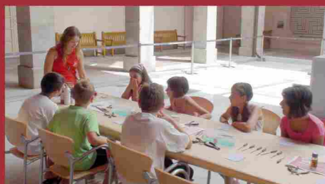
Talleres infantiles de la exposición 'Oro y Plata. Lujo y distinción en la Antigüedad hispánica'. (julio-septiembre 2010)