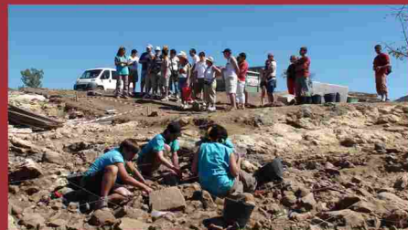
Jornada de Puertas Abiertas en los yacimientos arqueológicos de Pinilla del Valle (septiembre 2010)