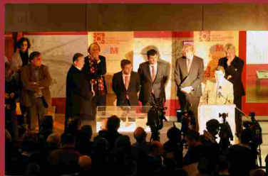
Presentación del contenido de la cápsula del tiempo encontrada bajo la estatua de Miguel de Gervantes, en la Plaza de las Cortes de Madrid. (diciembre 2009)