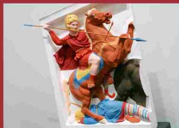
Imagen de una de las reproducciones

La exposición temporal ‘El color de los dioses’ -que fue inaugurada el pasado 18 de diciembre por el vicepresidente y consejero de Cultura y Deporte, Ignacio González- está integrada por unas 40 reproducciones de famosas esculturas y relieves clásicos que recrean la policromía reconstruida por diversos estudios científicos.