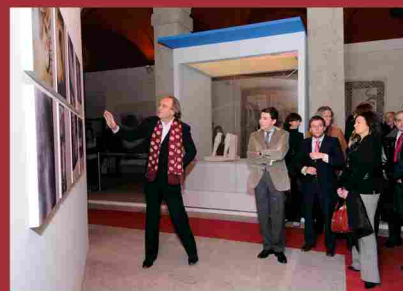
Inauguración de la exposición 'El color de los dioses'. (diciembre 2009)