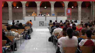
VI Jornadas de Patrimonio Arqueológico de la Comunidad de Madrid. (diciembre 2009)