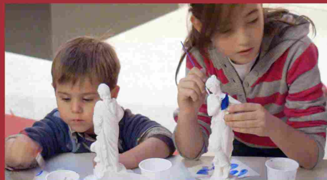
Dos de los participantes en el taller infantil ‘El color de los dioses’

Asimismo, como complemento a la exposición temporal, el MAR ha organizado una serie de visitas guiadas, que tienen lugar los sábados, a las 12 horas, y corren a cargo de un arqueólogo y experto en el tema.