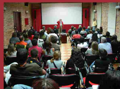
Proyección de la película Amanece que no es poco con la presencia de su director, José Luis Cuerda. (septiembre 2009)