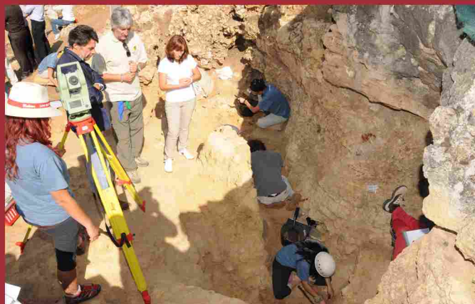
El vicepresidente de la CAM, Ignacio González, durante su visita a las excavaciones arqueológicas.

La VIII campaña de investigación se ha desarrollado en los yacimientos arqueológicos del Calvero de la Higuera, en el Valle Alto del Lozoya. Durante un mes, cerca de cien arqueólogos, paleontólogos y geólogos han trabajado para profundizar en el modo de vida del Homo neanderthalensis .