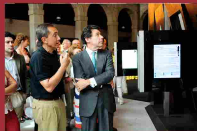
Inauguración de la exposición Ótzi, el hombre que vino del hielo. (julio 2009)