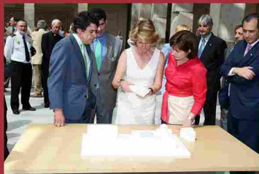
Presentación de la ampliación del Museo Arqueológico Regional por parte de la presidenta regional Esperanza Aguirre. (junio 2009)