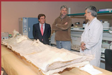
Presentación a la prensa de la restauración de los sarcófagos tardorromanos hallados en Arroyomolinos. (abril 2009)