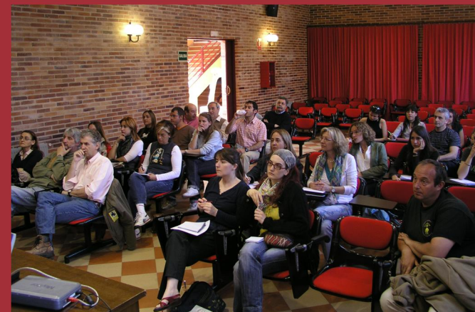
Imagen del ‘workshop’ celebrado en Pinilla del Valle.

Durante un mes, cerca de un centenar de arqueólogos, paleontólogos y geólogos trabajarán para profundizar en la economía del Homo neanderthalensis, así como para desentrañar las claves del comportamiento de los primeros pobladores de la Región. Estos yacimientos –declarados Bien de Interés Cultural, en la categoría Arqueológica y Paleontológica– son los únicos de la Comunidad de Madrid donde se han encontrado restos de homínidos.