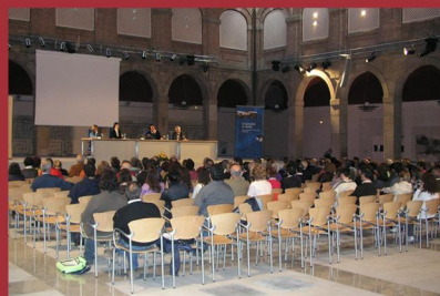
Curso de formación permanente para arqueólogos. Topografía para arqueólogos. (abril-mayo 2008)