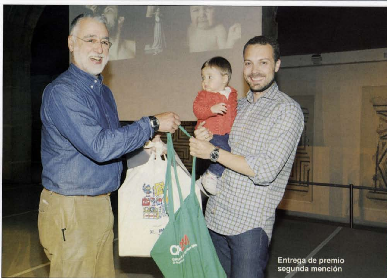
Entrega de premio segunda mención

Una propuesta coreográfica sobre "un metafórico cielo, un metafórico lugar donde habitan seres cargados y vacíos de esperanzas, desnudeces, miserias y grandezas, ancladas a un tiempo que no existe, manipulados por hilos de arena y luz. Onírico, intemporal, carente de medios terrenales, donde el tiempo es niebla y las almas cruzan... Heaven, es un espacio expresivo que cuenta y libera dos fuerzas en oposición, ¿lo que está arriba, está abajo? ¿Caemos? ¿Pero desde dónde? Todo depende hacia donde tene-