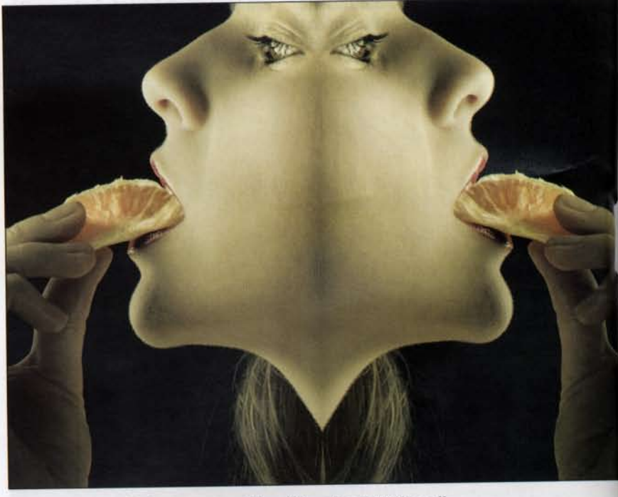
Primera mención: "Apetito lujurioso", donde la lujuria y la gula parecen ir de la mano.