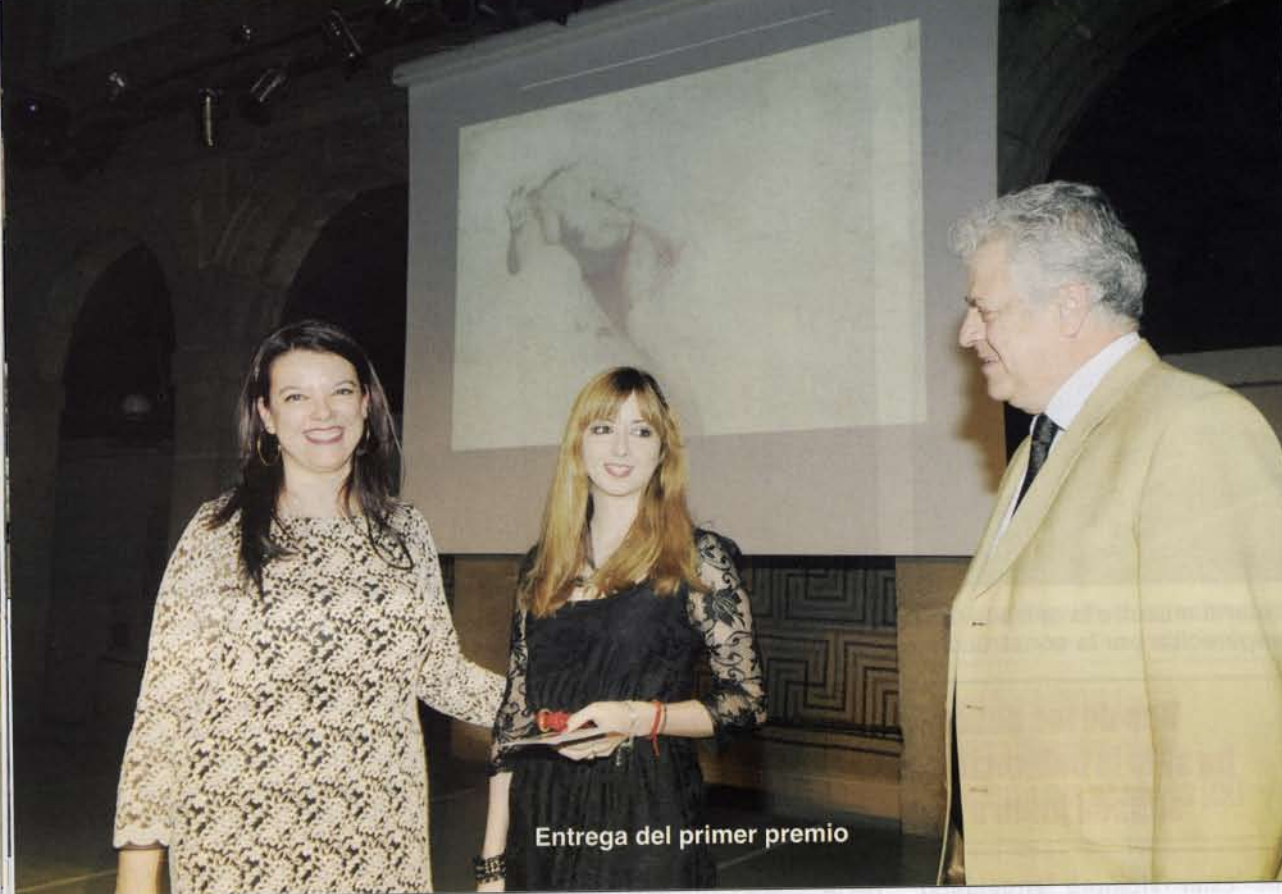
Entrega del primer premio