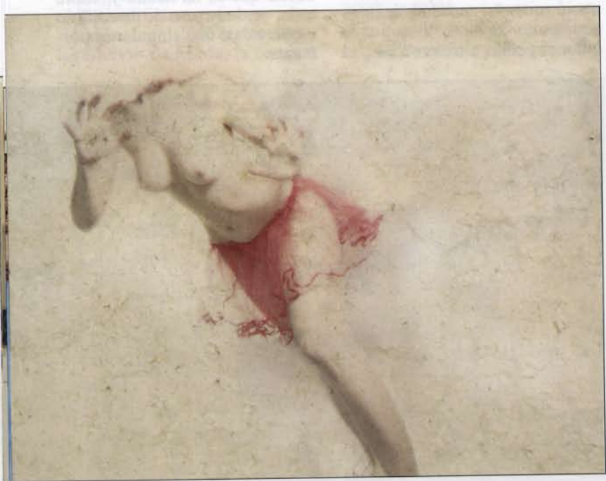
Primer premio: "La caída". Inspirada en la Venus de Milo y representa la caída de la humanidad, el pecado.

euros y tanto él como las dos menciones recibieron lotes de catálogos, revistas y libros científicos editados por la Universidad de Alcalá, el Centro de Arte Dos de Mayo y el Museo Arqueológico Regional, más objetos promocio-